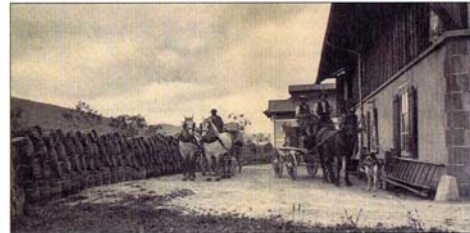
Le dépôt de bière de Paul Golay au Sentier en 1905. De quoi tenir un bon moment.