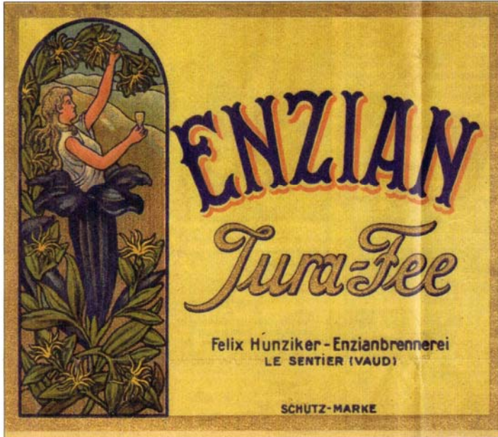
La Jura-Fee de Félix Hunziker - Etiquette d'une bouteille d'un litre. Environ de 1920. Les puristes auront remarqué que le graphisme fait référence à la gentiane bleue. Grave erreur au demeurant...