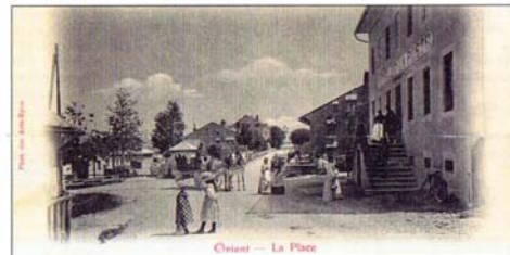
Livraison à L'Orient. On remarque à l'arrière-plan le même attelage. Chevaux et voituriers sont des robustes.