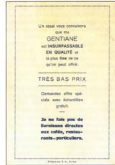
Tout l'art du marketing...